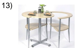
the little table